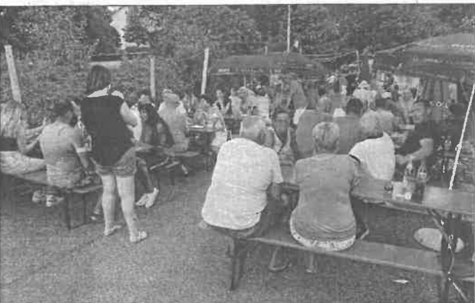
Die Bilder zeigen einige Impressionen vor dem Klingengewegfest und während des Klingengewegfests.