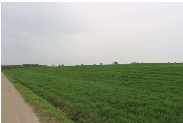
Planungsgebiet (südliche Grenze)