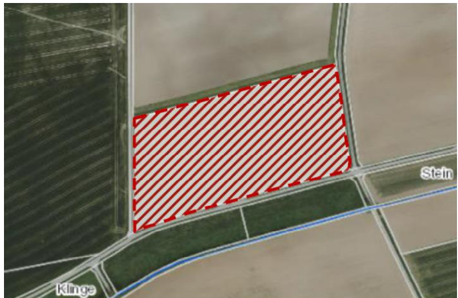
Lageplan der Planfläche (rot umrandet,. Quelle: Kartendienst der LUBW)

Das Plangebiet umfasst landwirtschaftlich genutzte Flächen in der Feldflur südlich von Steinbach. Auch die an das Plangebiet anschließenden Flächen werden als Acker genutzt. Südlich des Plangebiets in einem Abstand von etwa 50m verläuft der Ohrenbach mit Gewässerbegleitgehölzen.