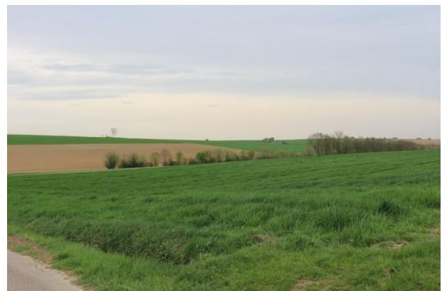
Planungsgebiet (nordöstliche Grenze)